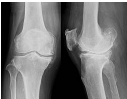
変形性膝関節症 術前

人工膝関節は、すり減った軟骨や傷んだ骨を薄く切除し、金属、セラミック、ポリエチレンでできた人工関節に置き換える手術です。軟骨と骨をとり除く際に、骨・軟骨の切除量、靭帯のバランスなどを調整することによって、O脚の患者さんは下肢をまっすぐに矯正します。痛みの原因をとり除き、人工関節に置き換えることによって、膝の痛みをなくすことが期待されます。