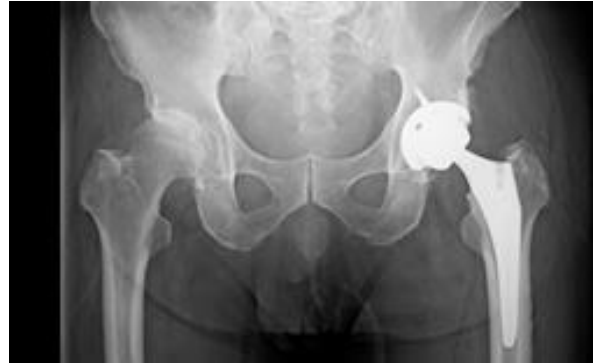
人工股関節置換術 術後

人工膝関節は、すり減った軟骨や傷んだ骨を薄く切除し、金属、セラミック、ポリエチレンでできた人工関節に置き換える手術です。軟骨と骨をとり除く際に、骨・軟骨の切除量、靭帯のバランスなどを調整することによって、O脚の患者さんは下肢をまっすぐに矯正します。痛みの原因をとり除き、人工関節に置き換えることによって、膝の痛みをなくすことが期待されます。